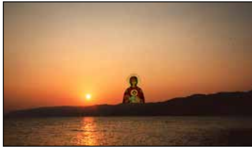
Το περιβόλι της Παναγίας υπό τη σκέπη της

ου, η Μονή Ξενοφώντος, η Μονή Κωνσταμονίτου και η Μονή Ζωγράφου ήταν σε κατάσταση εγκατάλειψης, πλην της Μονής Σταυρονικήτα , η οποία, το 1974, είχε γίνει κοινόβιο μοναστήρι και είχε συγκροτημένη παρουσία, με νέους στην ηλικία και μορφωμένους μοναχούς, κυρίως φοιτητές από το Πανεπιστήμιο της Θεσσαλονίκης, οι οποίοι είχαν οργανώσει μια πολύ αξιόλογη κοινότητα, με πολύ μεγάλο πνευματικό ενδιαφέρον. Εδώ μέيناμε και τις περισσότερες ημέρες της παραμονής μας στο Άγιο Όρος, γιατί βρήκαμε μοναχούς που μπορούσαμε να συζητήσουμε. Ήταν