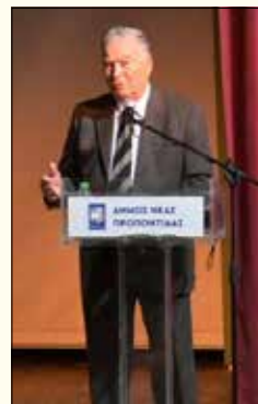
Ο Συγγραφέας του βιβλίου