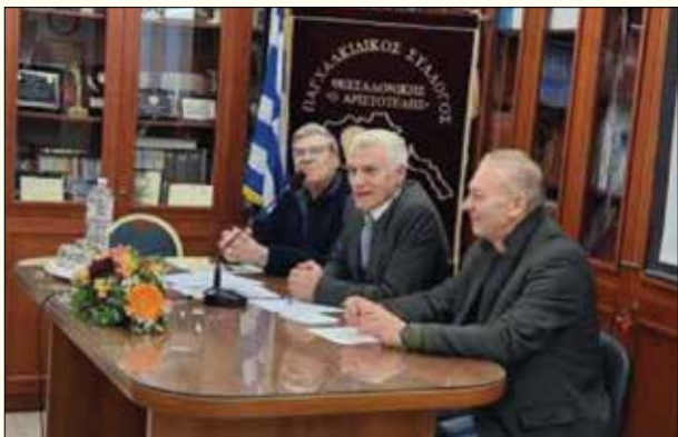
Το Προεδρείο της Γενικής Συνέλευσης