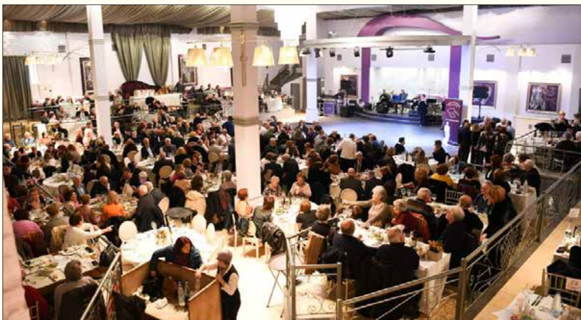
Η κατάρμεστη αίθουσα του πολυτελούς κέντρου ALEA