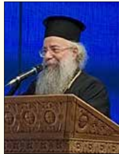
Ο Θεοφ. Επίσκοπος Μπουκόμπα κ. Χρυσόστομος