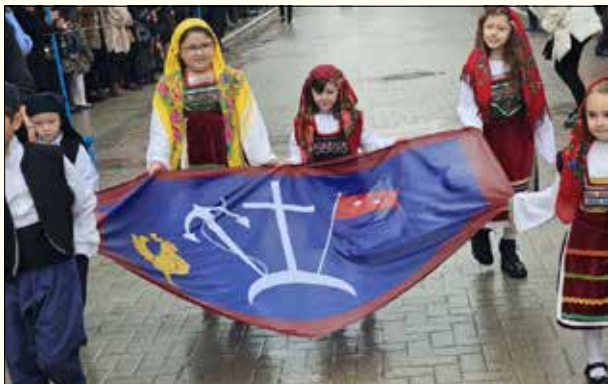
Στα Νέα Μουδανιά με την Σημαία της Επανάστασης της Χαλκιδικής