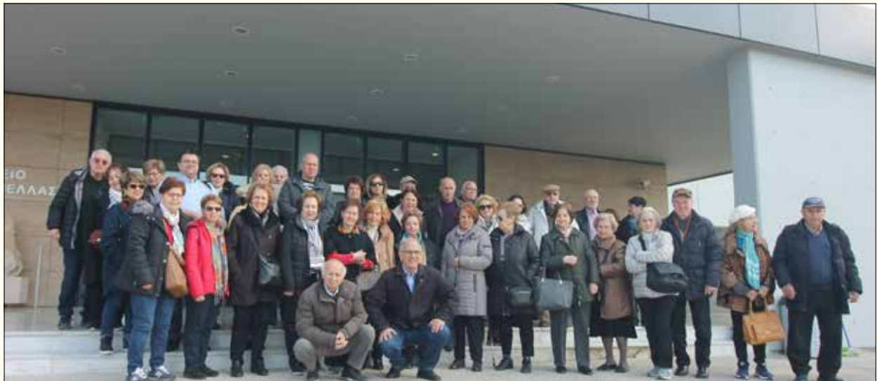
Στο Αρχαιολογικό Μουσείο Πέλλας