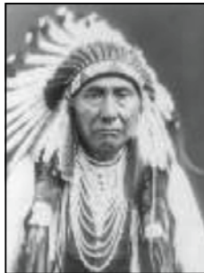
Εικ. 2. Chief Joseph (1840-1904 μ.Χ.)