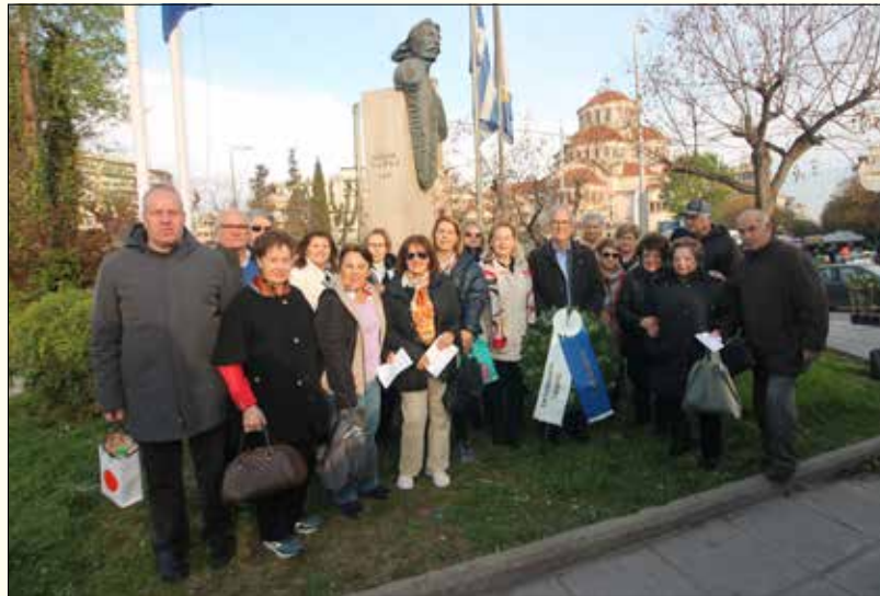
Κατάθεση στεφάνου στην Προτομή του Καπετάν Χάψα πριν την αναχώρηση