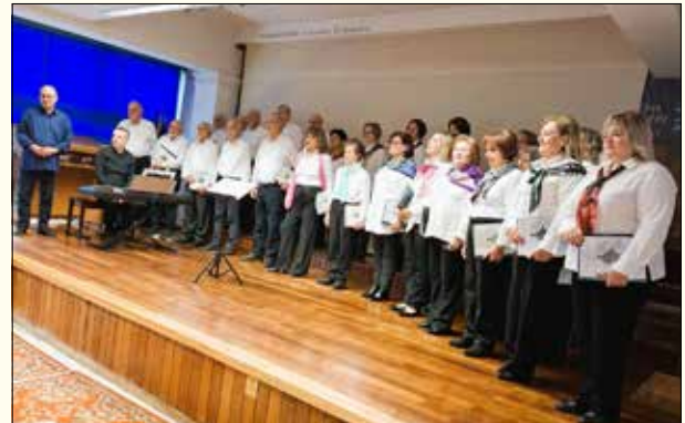
Η χορωδία του Παγκοσμίου Συλλόγου