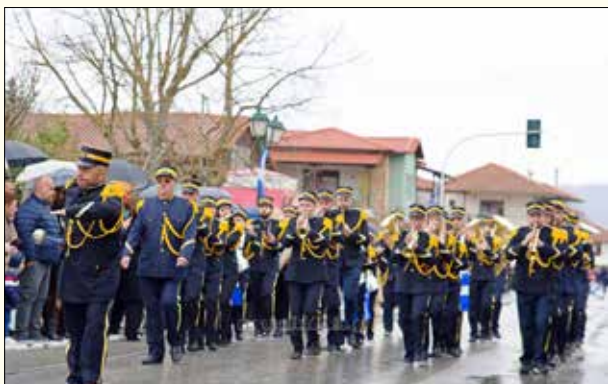
Στην Αρναία η Φιλαρμονική που εντυπωσίασε