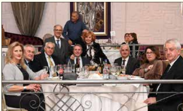
Μέλη του Δ.Σ. με τον Δήμαρχο Πολυγύρου