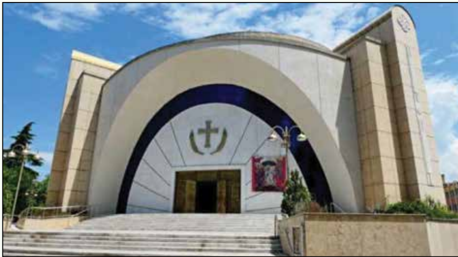
Ο περικαλής Καθεδρικός Ναός της Αναστάσεως του Χριστού στο κέντρο των Τιράνων, είναι έργο του Μακαριστού Αρχιεπισκόπου Αλβανίας Αναστασίου