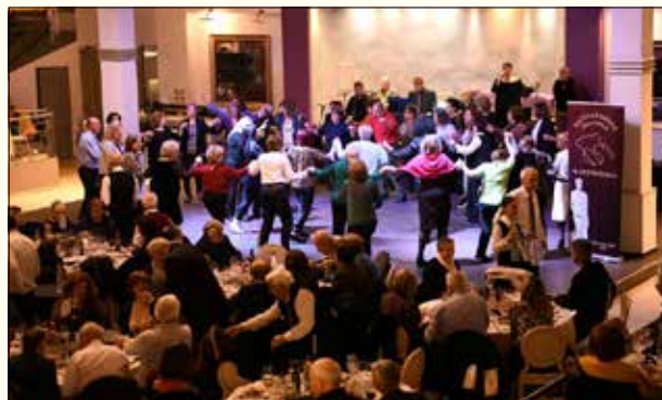
Μέλη και φίλοι του Συλλόγου στην πίστα