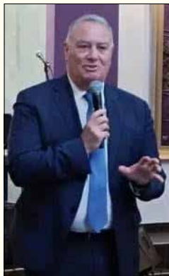
Από τον Βουλευτή κ. Ιωάννη Γιώργο