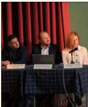
Οι παρουσιαστές του βιβλίου