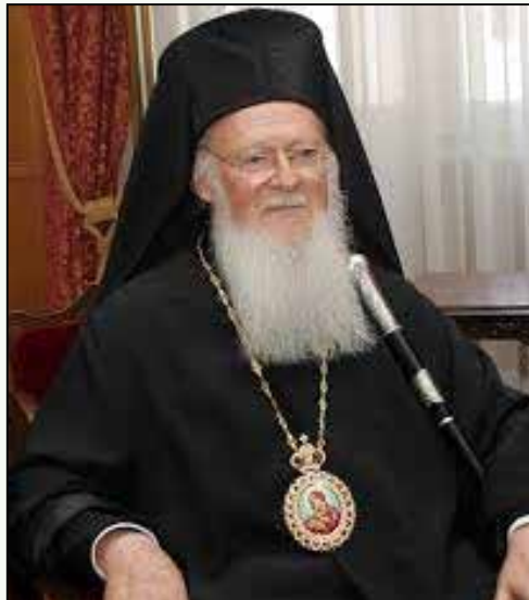
Ο Οικουμενικός Πατριάρχης κ.κ. Βαρθολομαίος

«Ο γνωρίζων την ελληνικήν γλώσσαν είναι αδύνατον να μη φιλοσοφή και να μη θεολογή. Ορθώς έχει λεχθή ότι οι φιλοσοφούντες, όπου γης, «στοχάζονται ελληνικά». Κατ' αντιστοιχίαν, δεν είναι τυχαίον το γεγονός ότι η Ελληνική κατέστη η κομβική γλώσσα και της χριστιανικής θεολογίας. Διά μέσου αυτής επετεύχθη ο μέγας φιλοσοφικός και θεολογικός άθλος, να εκφρασθή αυθεντικώς και με αξιοθαύμαστον τρόπον το βίωμα της εν Χριστώ σωτηρίας διά μέσου της ορολογίας της ελληνικής φιλοσοφίας, και να καταστή η σύζευξις Χριστιανισμού και Ελληνισμού καθοριστική καμπή όχι μόνον εις την πορείαν της Εκκλησίας και της θεολογίας, αλλά και εις την ιστορίαν του πνεύματος και του πολιτισμού.