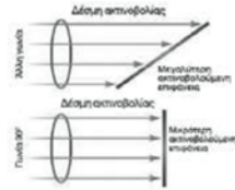
Εικ. 1: Από τη γωνία πρόσπτωσης των ακτίνων εξαρτάται η πυκνότητα της ροής ενέργειας σε μια επιφάνεια

Η εναλλαγή των εποχών συσχετίζεται με τις θερμοκρασιακές αλλαγές που συμβαίνουν στην επιφάνεια της Γης, δηλαδή με τη μεταβολή της ηλιακής ακτινοβολίας που πέφτει στην επιφάνεια ενός τόπου. Η μεταβολή αυτή της θερμοκρασίας οφείλεται κυρίως στη μεταβολή της κλίσης των ακτίνων του Ήλιου που πέφτουν στην επιφάνεια της Γης, διότι η κλίση των ακτίνων είναι αυτή που ρυθμίζει το εμβαδό της επιφάνειας της Γης πάνω στην οποία σκορπίζεται η ενέργεια που κουβαλάει μια συγκεκριμένη δέσμη ακτινοβολίας του Ήλιου μας (Εικ. 1).