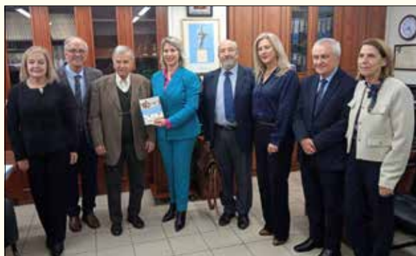
Μέλη του Δ.Σ. με τους συντελεστές του βιβλίου και την Αντιπεριφερειάρχη