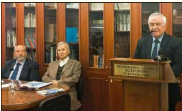
Ο συγγραφέας, ο παρουσιαστής και ο συντονιστής της εκδήλωσης