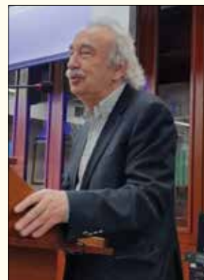
Χρήστος Πάχτας, τ. Υπουργός, Χαιρετισμός