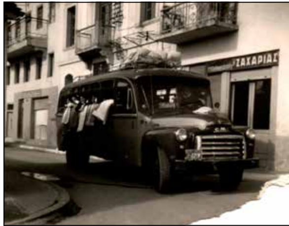
Το λεωφορείο που έφερνε και έπαιρνε τους μουσαφίρηδες

Βέβαια, εκτός από τους μουσαφίρηδες που έρχονταν στον Πολύγυρο για δουλειές, έρχονταν ως μουσαφίρηδες και κάποιοι συγγενείς μας ή φίλοι μας από άλλα χωριά για να περάσουν λίγες μέρες μαζί