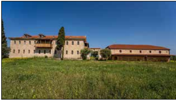
Μετοχιακό Συγκρότημα Ν. Φλογητών

καιώνει τους Ιβηρίτες στη διαμάχη που είχαν με τους μοναχούς της μονής του Αγίου Παντελεήμονος για το μετόχι στην Καλαμαριά. Οι διαμάχες μεταξύ των δύο μοναστικών αδελφοτήτων συνεχίστηκαν και τις επόμενες δεκαετίες με μήλο της έριδος τις εκτάσεις που κατείχαν στην περιοχή της Καλαμαριάς οι δύο αθωνικές μονές.