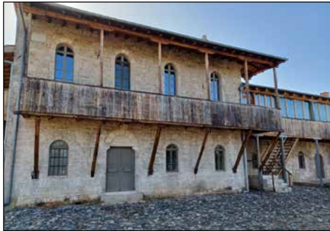
Μετοχιακό Συγκρότημα Ν. Φλογητών

Σήμερα τα εν λόγω κτίρια έχουν αποκαταστηθεί και φιλοξενούν εργαστήρια συντήρησης και εκθεσιακούς χώρους.