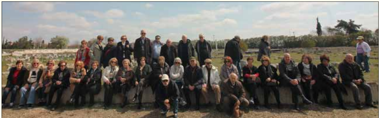
Στον Αρχαιολογικό χώρο της Πέλλας