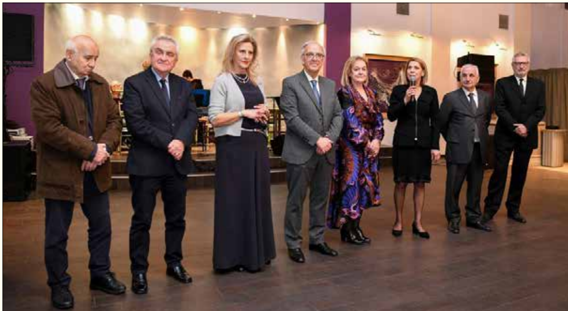
Το Διοικητικό Συμβούλιο του Παγχαλκιδικού Συλλόγου