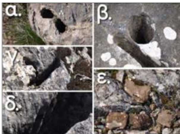
Εικόνα 2. α) σύνολο κογχών, β) σχισμή και κόγχη με αύλακες, γ) σχισμές με εμφανή τα ίχνη της σμίλης, δ) τα κάθετα και ιδιαίτερα κυρτά ίχνη της σμίλης (η ίδια φωτογραφία σε μεγέθυνση), ε) κεραμική ανάμεσα στους βράχους.

Η θέση δίπλα από το εξωκκλήσι του Αποστόλου Παύλου εμφανίζει κάποια κοινά χαρακτηριστικά με το Νταμάρι, που ίσως δεν είναι καθόλου τυχαία. Πρώτο κοινό χαρακτηριστικό είναι οι φυσικοί βράχοι, δεύτερο η ύπαρξη πηγών νερού (συνήθως μικροί χείμματοι) σε κοντινή απόσταση και τρίτο η ύπαρξη χριστιανικού ναού πλησίον