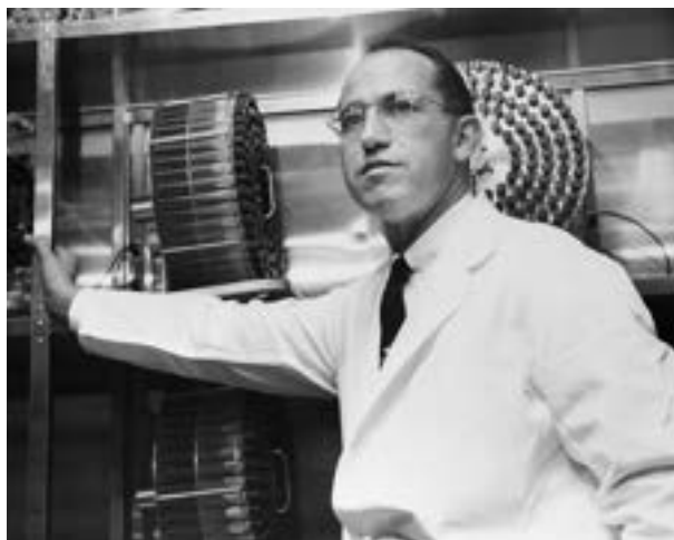
Ο Σολ στο εργαστήριό του στο Πανεπιστήμιο του Πίτσμπουργκ, όπου ανακάλυψε το εμβόλιο.

Στα τέλη της δεκαετίας του 1940, η επιστημονική κοινότητα είχε αρχίσει να κατανοεί καλύτερα τη δράση του ιού. Ανακαλύφθηκε ότι εισέρχεται στον οργανισμό μέσω του πεπτικού συστήματος και περνά στο αίμα. Την ίδια περίοδο, δύο βασικές προσεγγίσεις για την ανάπτυξη εμβολίου άρχισαν να διαμορφώνονται. Ο Αλμπερτ Σέιμπιν υποστήριζε τη χρήση εξασθενημένου ιού, επιλέγοντας μια πιο προσεκτική και σταδιακή προσέγγιση. Αντίθετα, ο Τζόννας Σολκ, με εμπειρία στην ανάπτυξη εμβολίου κατά της γρίπης κατά τον Β' Παγκόσμιο Πόλεμο, κινήθηκε ταχύτερα, επιλέγοντας τη χρήση πλήρως αδρανοποιημένου ιού. Η χρηματοδότηση που έλαβε από τον οργανισμό που είχε ιδρύσει ο Ρούζβελτ έδωσε στον Σολκ ένα σημαντικό πλεονέκτημα.