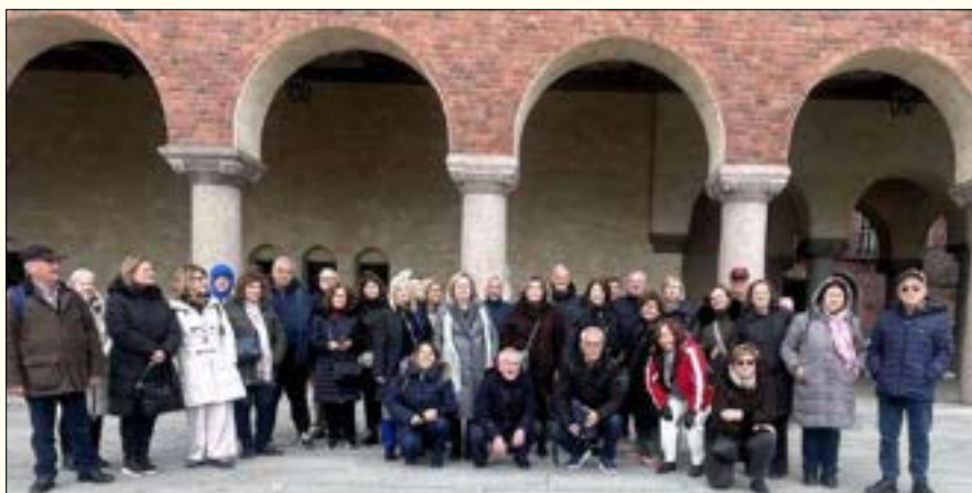
Στο Δημαρχείο της Στοκχόλμης