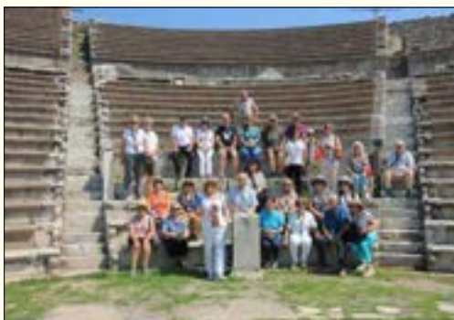
Στο θέατρο της Περγάμου