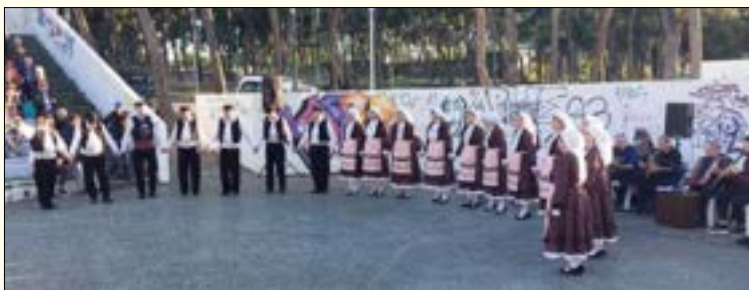
ΚΥΡΙΑΚΕΙΑ: Άλσος Νέας Ελβετίας