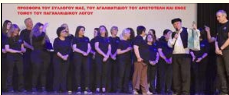
Στιγμιότυπο από την ανταλλαγή αναμνηστικών