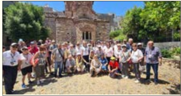
Πυργί Χίου: Ιερός Ναός Αγίων Αποστόλων