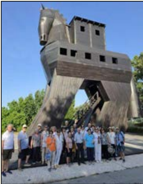
Τροία - Δούρειος Ίππος