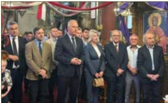
Στο Καθολικό της Μονής