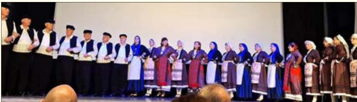
Το χορευτικό στο Φεστιβάλ της Στοκχόλμης