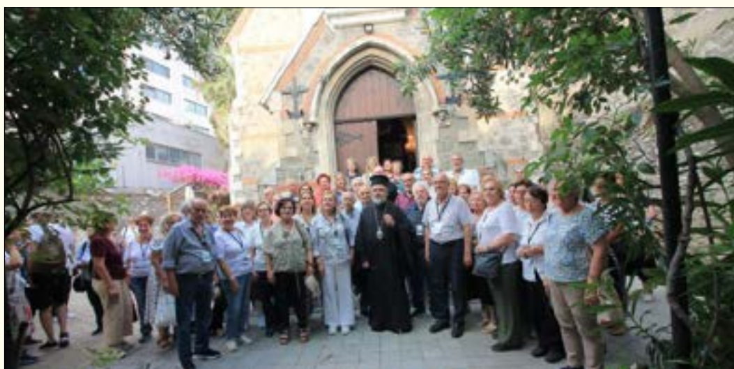
Με τον Μητροπολίτη Σμύρνης κ.κ. Βαρθολομαίο στην Ορθόδοξη Εκκλησία