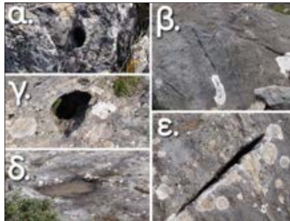
Εικόνα 1. α) οπή, β) αύλακες, γ) κόγχη, δ) αβαθής κοιλότητα (με ένα λεπτόκοκκο καφέ-γκρίζο ίζημα στο εσωτερικό της), ε) σχισμή.

Οι χοές μπορούσαν να ήταν νερό ή οποιοδήποτε προϊόν σε υγρή μορφή, όπως γάλα (συνήθως αναμειγμένο με μέλι), κρασί και λάδι. Αναφορά σε χοές γίνεται και στην Οδύσεια (Οδ. κ 517-520). Ένα μεγάλο ερώτημα είναι αν όλοι οι τύποι λαξεύσεων δεχόντουσαν τα ίδια προϊόντα. Η ύπαρξη επαναλαμβανόμενων μοτίβων (σύνολα λαξεύσεων), μπορεί να οδηγήσει στο συμπέρασμα ότι κάθε τύπος λάξευσης, ανάλογα με τα χαρακτηριστικά του (π.χ. χωρητικότητα), δεχόταν ως προσφορά ένα διαφορετικό προϊόν. Χαρακτηριστικό παράδειγμα αποτελεί το