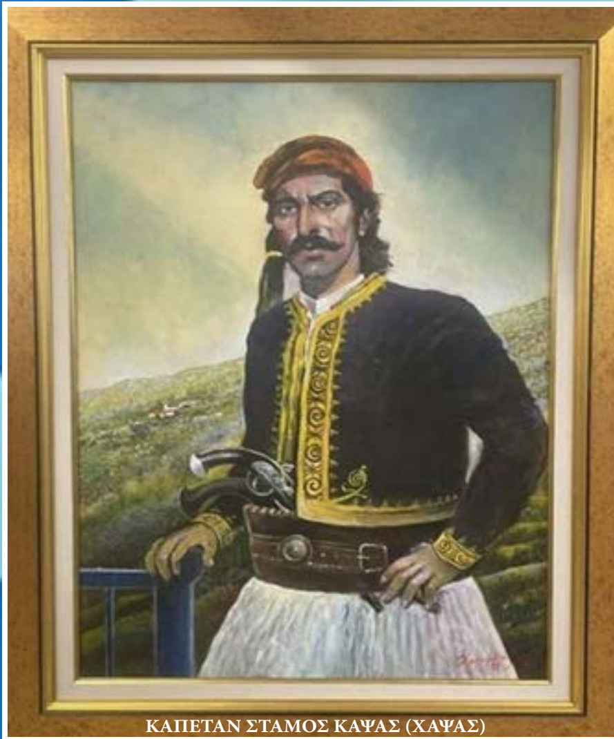
ΚΑΠΕΤΑΝ ΣΤΑΜΟΣ ΚΑΨΑΣ (ΧΑΨΑΣ)

Ένας λεβέντς, ένα παλικάρ', όμορφο σαν το ελάφ', Κάψας είναι τ' όνομά του, Κάψας είν' το παλικάρ'. Χαλκιδική το 'χει καμάρ', γιατί με λύσσα πολεμάει, γιατί με λύσσα πολεμάει όλα τα τούρκικα σκυλιά. Έχει στήθια λιονταριού, δύναμη στα χέρια του, έχει μάτι αετού κι όμορφα σγουρά μαλλιά. Έχει σπαθιά ατσάλινα, καριοφίλια μπρούτζινα. Κάψας δοξάζει τη Ρωμιά και τον τρέμει η Τουρκιά. Κασσαντρινός Κάψας αρχηγός, πολεμάει μοναχός, πολεμάει μοναχός την αμέτρητη Τουρκιά.