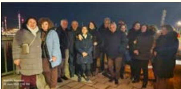
Από τη βραδινή περιήγηση