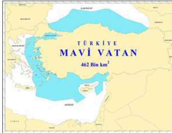
Εικ. 1. Χάρτης της «Γαλάζιας Πατρίδας» του Τζιχάτ Γιαϊτζί 1

Γιατί κάθε μορφωμένος άνθρωπος, Τούρκος, Έλληνας ή από οποιαδήποτε άλλη χώρα, ασφαλώς και χαμογελάει, όταν σας ακούει να αναφέρεστε στα Ελληνικά νησιά του Αιγαίου, ισχυριζόμενος ότι « σε αυτά τα νησιά έχουμε την ιστορία μας, τα μνημεία μας, τα τζαμιά μας! ». Όλοι οι στοιχειωδώς μορφωμένοι άνθρωποι σε ολόκληρο τον πλανήτη, γνωρίζουν πως το Αιγαίο πέλαγος, από την χαραυγή της ιστορίας ήταν και παραμένει Ελληνικό. Οι περιστασιακοί κατακτητές,