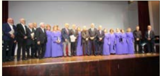
Από την εμφάνιση της χορωδίας στο Πολεμικό Μουσείο Αθηνών