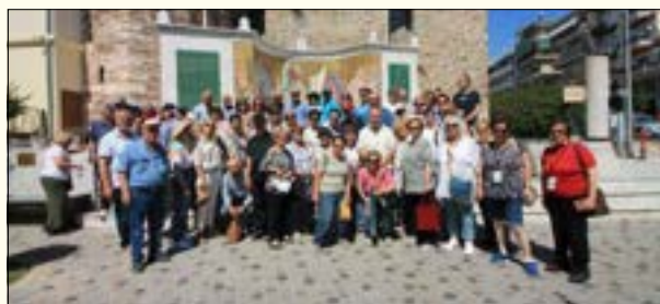
Στο βήμα του Απ. Παύλου, Καβάλα