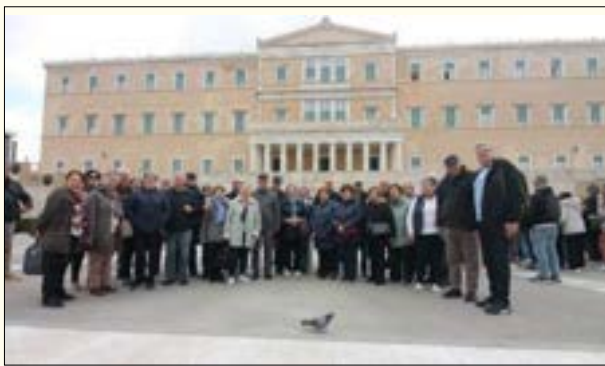
Στην Πλατεία Συντάγματος-Βουλή