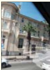
Σπίτια που διασώθηκαν στην παραλία της Σμύρνης