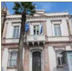
Ελληνικό Προξενείο στην Σμύρνη