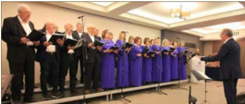
Η χορωδία στο ξενοδοχείο Miraggio στην Κασσάνδρα