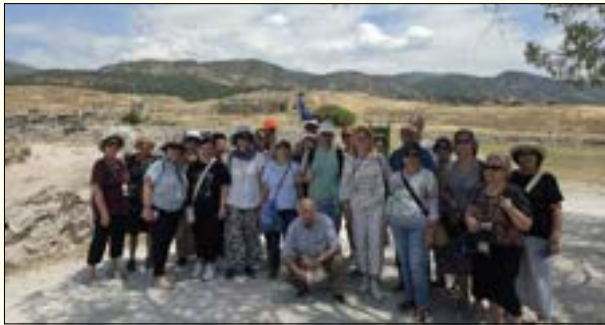
Πέργαμος - Ασκληπιείο