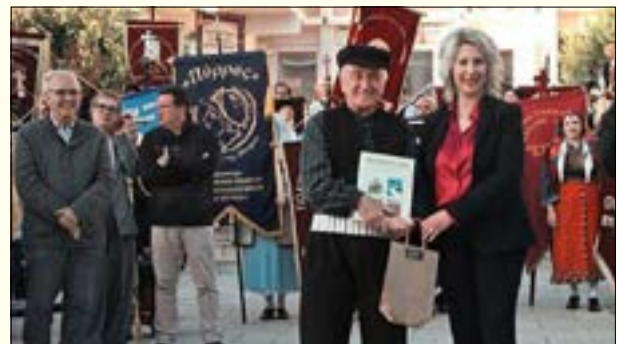
Από τη συμμετοχή του χορευτικού μας στην Πατινάδα στον Πολύγυρο