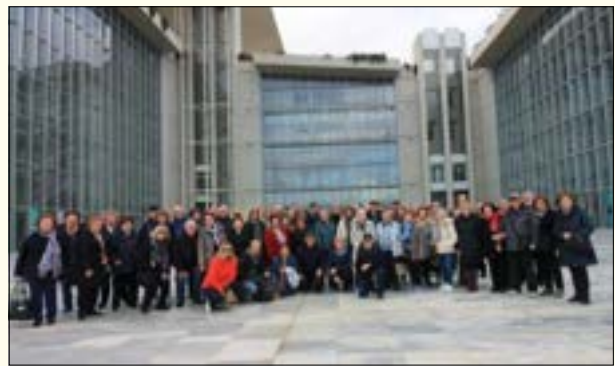
Στο Ίδρυμα Νιάρχου