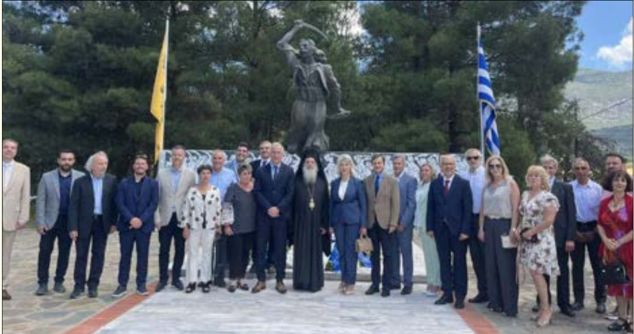
Στο χώρο του Μνημείου