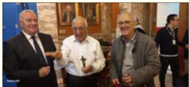
Ο Πρόεδρος του Παγκληθικού με τον Πρόεδρο της Βουλής και τον Βουλευτή Χαλκιδικής