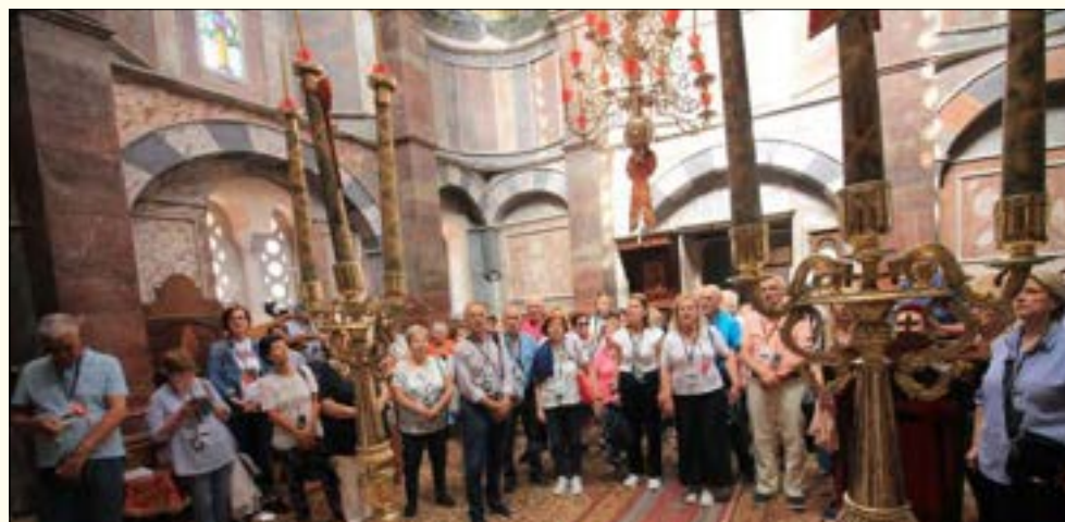
Στην Ιερά Νέα Μονή Χίου