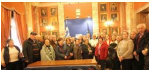
Με τον Πρόεδρο της Βουλής κ. Νικήτα Κακλαμάνη