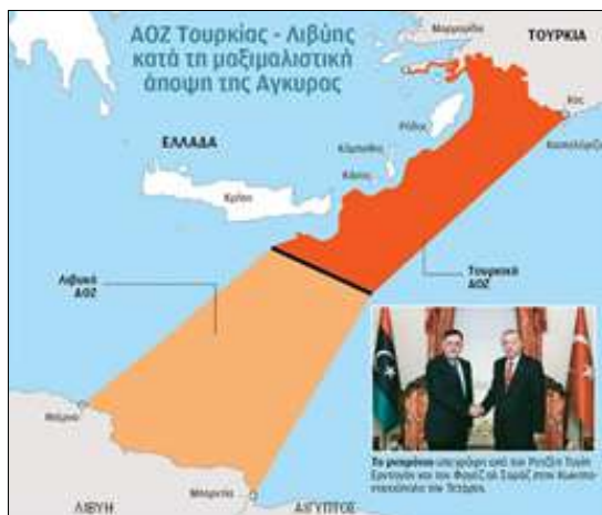
Εικ. 2. Χάρτης με το παράνομο Τουρκο-Λιβυκό Σύμφωνο Θαλάσσης

Γιατί θα πρέπει να γνωρίζετε πως τα σύνορα της καρδιάς των Ελλήνων πάντοτε θα φθάνουν μέχρι