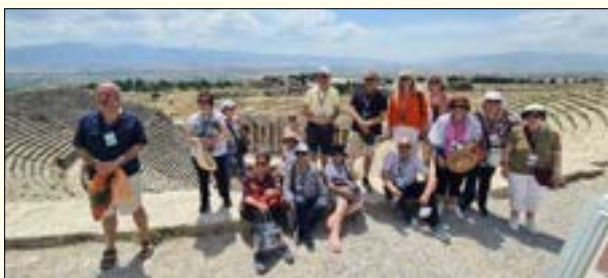
Στο θέατρο Ιεράπολης