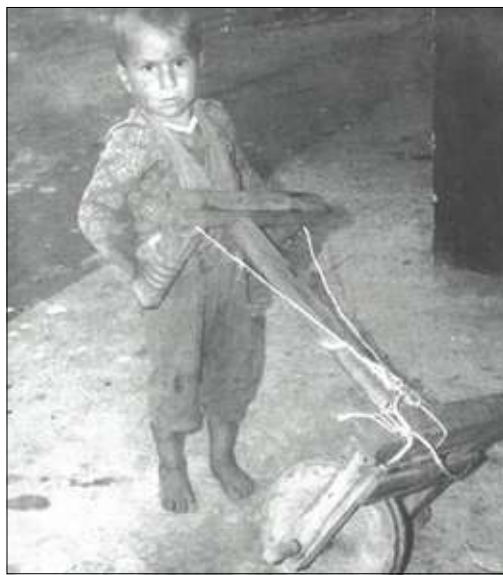
Αυτοσχέδιο καρότσι, 1956

Όταν γεννιόταν το μωρό, έπρεπε να το προφυλάξουν από τις μαγικές επιδράσεις. Εκτός από το χαρούμενο περιβάλλον που δημιουργούνταν με τα νανουρίσματα, τα παιχνιδίσματα, τα ταχταρίσματα, η κούνια και η πολύχρωμη, υφαντή, πρόκνια, ήταν γεμάτα ματόχαντρα, σκόρδα, θυμιατήρια «τα ξόρκια», μέχρι το βάπτισμα, τότε του κρεμούσαν στο λαιμό το Σταυρό, για να μην επηρεάζεται το παιδί από «τα