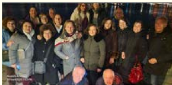
Από τη βραδινή περιήγηση