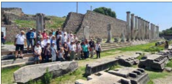
Πέργαμος - Ασκληπιείο