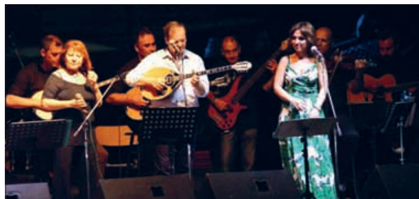
Δήμος "Αριστοτέλης" (ρεπ. σελ. 40)