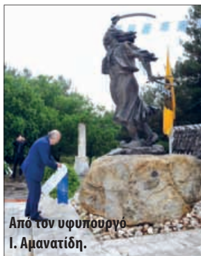
Από τον υφυπουργό Ι. Αμανατίδη.