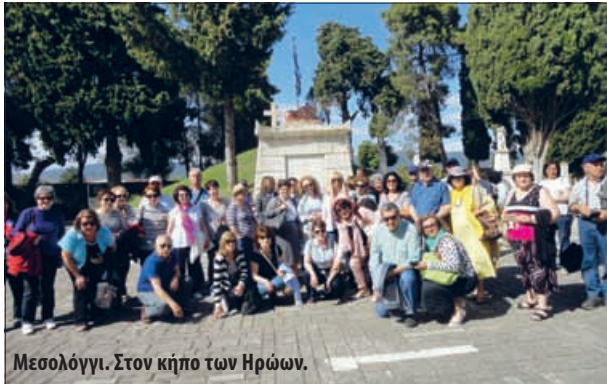
Μεσολόγγι. Στον κήπο των Ηρώων.