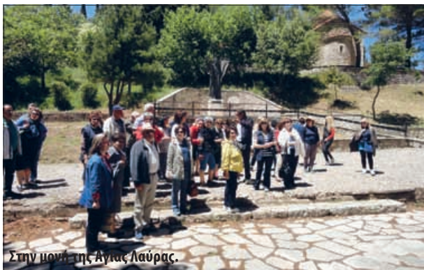
Στην μονή της Αγίας Λαύρας.