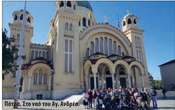
Πάτρα. Στο ναό του Αγ. Ανδρέα.