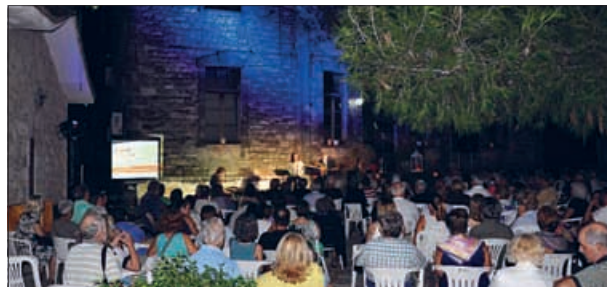
Δήμος Σιθωνίας (ρεπ. σελ. 39)