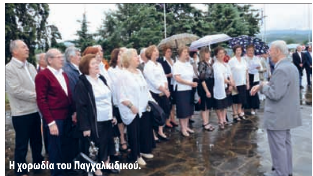
Η χορωδία του Παγγαλικείου.