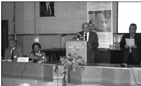
Ο Αναπλ. Υπουργός Εξωτερικών Ιωάννης Αμανατίδης κηρύσσει την έναρξη των εργασιών του Παγκόσμιου Επιστημονικού Συμποσίου της ΕΜΣ παρουσία της Συντ. Επιτροπής (Β. Πάππας, Ε. Τέγου, Γ. Τσότσος)

κοινή καταγωγή τη Μακεδονία μας. Ανθρώπους, που για πολλούς το όνειρο της επιστροφής μπορεί μερικές φορές να ξεθωιάζει, αντικαθίσταται όμως από την επιθυμία να βοηθήσουν την Πατρίδα τους, την Ελλάδα όλων μας, να αναγνωριστεί η προσφορά τους. Και αν το όνειρό τους αυτό, όπως το εννοεί ο Καβάφης, είναι της αναγνώρισής τους από τη Μητροπολιτική Ελλάδα, τότε ναι, έχει γίνει πραγματικότητα. Και όχι μόνον η προσφορά των Μακεδόνων της Διασποράς στην ανάπτυξη της Μακεδονίας αναγνωρίζεται καθημερινά, αλλά όλη η Ελλάδα, όλο το Έθνος, αισθάνεται πλέον περήφανο για σας, που δημιουργήσατε και προκόψατε εκεί που πήγατε, που διακριθήκατε σε όλους τους τομείς: επιστήμες, πνεύμα, έρευνα, τέχνες, καθημερινός μόχθος, κατάληψη νευραλγικών θέσεων στις νέες σας Πατρίδες. Εσείς που γίνετε οι καλύτεροι πρέσβεις της χώρας μας στο εξωτερικό, που δημιουργήσατε την Ελλάδα της Οικουμένης. Γνωρίζουμε βεβαίως καλά, ότι και σεις έχετε τους προβληματισμούς σας, τις ανησυχίες σας για τη χώρα μας, για τις μελλοντικές εξελίξεις, για την προάσπι-