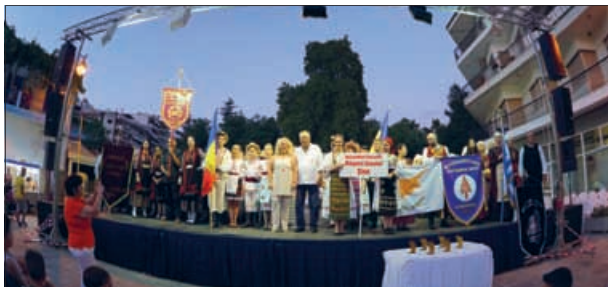
Δήμος Πολυγύρου (ρεπ. σελ. 37)