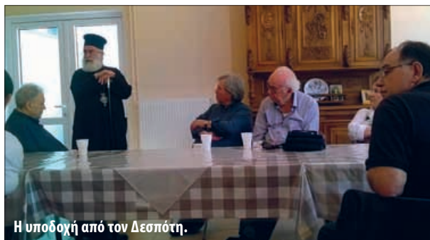
Η υποδοχή από τον Δεσπότη.