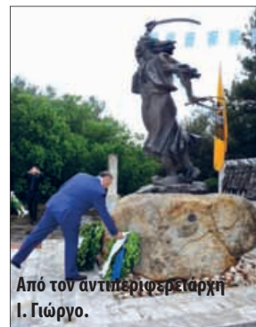
Από τον αντιπεριφερειάρχη Ι. Γιώργο.