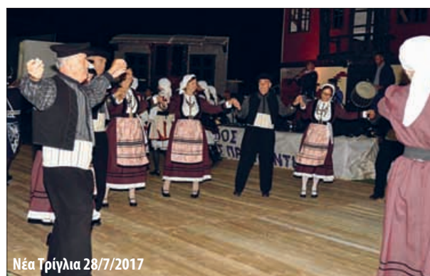
Νέα Τρίγλια 28/7/2017