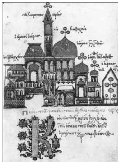
Ο Άγιος Τάφος και άλλα κτίσματα, αρχικό γράμμα Κ (Γρηγορίου 159, φ. 2σ). 17ος αι. Προσκυνητάριο Αγίων Τόπων.

Τέλος, χάθηκαν κατά καιρούς αρκετά από τα συγκεκριμένα χειρόγραφα, καθώς δεν μπόρεσαν να σταματήσουν τις «αποδημίες» τους ούτε οι κρύπτες, όπου τα διατηρούσαν σε κρίσιμες στιγμές οι Αγιορείτες μοναχοί, καθώς πρόκειται για κινητές αξίες, που εύκολα περιέρχονται από τόπο σε τόπο, αλλάζοντας πολλούς κατόχους. Έτσι, αυτή τη στιγμή έχουν απομακρυνθεί από μόνες ή σκήτες του Αγίου Όρους ολόκληρες συλλογές ή μεμονωμένα χειρόγραφα, ιδιαίτερα κλασικών κειμένων, τα οποία αφαιρέθηκαν με ποικίλους τρόπους (κλοπή, αγορά κλπ.) και κοσμούν διάφορες βιβλιοθήκες της Ευρώπης και των Ηνωμένων Πολιτειών της Αμερικής. Ενδεικτικά, αναφέρουμε τα χειρόγραφα της σκήτης του Αγίου Ανδρέα στις Καρυές, που μεταφέρθηκαν στις ΗΠΑ από τον T. Whitmore και