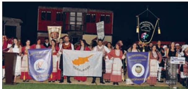
Δήμος Κασσάνδρας (ρεπ. σελ. 38)