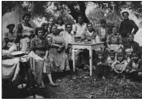
Στο πανηγύρι της Βουρβουρούς τη δεκαετία 1950.

Τα παλικαρόπουλα, καβάλα στ' άλογα, με τα χρωματιστά στρωσίδια στο σαμάρι, όπου ξακρύνουν την κοπελιά που βάλανε στο μάτι, θα πισωγυρίσουν, θα κάνουν μια γυροβολιά, θα σπιρουνίσουν τ' άλογο και