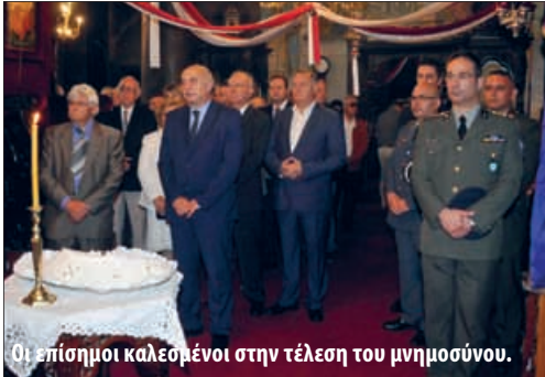
Οι επίσημοι καλεσμένοι στην τέλεση του μνημοσύνου.