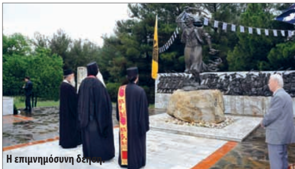
Η επιμνημόσυνη δέηση.