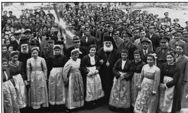
Γιορτή της ΕΟΝ εις τον προ του Ηρώου χώρον 11-8-1940.

Η εφημερίς μας εκτιμώσα την αξιαιπενον προσπάθειαν του... Παγχαλκιδικού Συλλόγου, όπως δι εκδρομών φέρει εις επαφήν τους εν Θεσ/νίκη συμπατριώτας μας