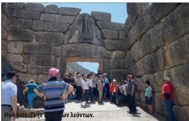
Μυκήνες. Στην Πύλη των Λεόντων.