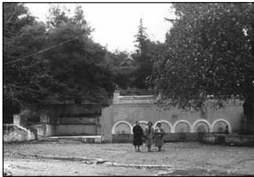
Πολύγυρος, Έξι βρύσες, 1958.

Τότε άρχισε να μου ανοίγεται ένας καινούργιος κόσμος, καθώς γνώριζα σε βάθος την ψυχή, τη γλώσσα, τα έθιμα, τις συνήθειες και την κουλτούρα των Πολυγυρινών και των υπολοίπων Χαλκιδικιωτών.