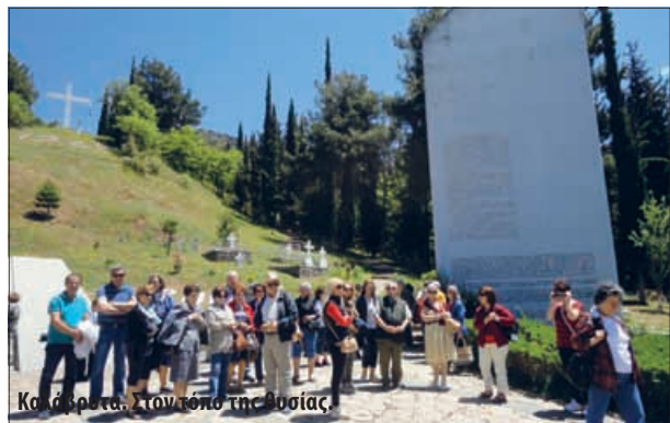
Καλάβρυτα. Στον τόπο της θυσίας.