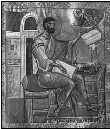
Ο Ευαγγελιστής Μάρκος (Κουτλουμουσίου 61, φ. 112β). 13ος αι. Ευαγγέλιο.

Στο Άγιον Όρος σώζονται πάνω από 600 εικονογραφημένα ελληνικά χειρόγραφα, τα περισσότερα κώδικες και ελάχιστα ειλητάρια. Σ' αυτά προστίθενται πολύ λίγα σπαράγματα και ένας μικρός αριθμός ξενόγλωσσων χειρογράφων. Εντοπίζονται όλα στις βιβλιοθήκες του Πρωτάτου και των είκοσι μονών, καθώς και ορισμένων σκητών. Στην πλειονότητά τους είναι θρη-