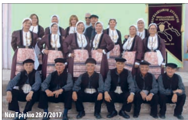
Νέα Τρίγλια 28/7/2017