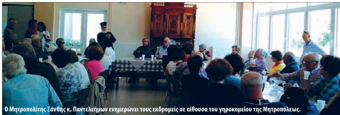
Ο Μητροπολίτης Ξάνθης κ. Παντελεήμων ενημερώνει τους εκδρομείς σε αίθουσα του γηροκομείου της Μητροπόλεως.