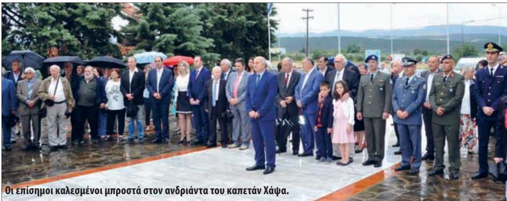
Οι επίσημοι καλεσμένοι μπροστά στον ανδριάντα του καπετάν Χάψα.