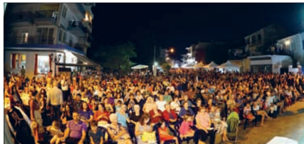
Δήμος Ν. Προποντίδας (ρεπ. σελ. 38)