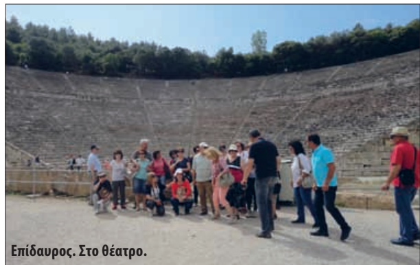
Επίδαυρος. Στο θέατρο.