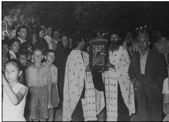
Ἀπό τήν περιφορά τῆς θαυματουργῆς εἰκόνας τῆς Παναγίας το Δεκαπενταύγουστο στο προσκύνημα τῆς Μεγ. Παναγίας Χαλκιδικῆς (δεκ. '50).

Ἡ Κοίμηση, λοιπόν, τῆς Θεοτόκου δέν εἶναι ξόδι,